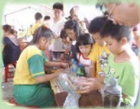
▲以畢業生為關主的科學博會