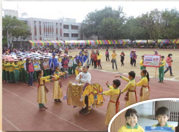
▲ 配合校慶進場展示泰國國旗舞蹈