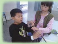
▲莖奇之旅教案教學