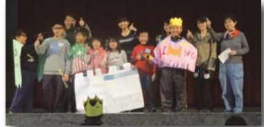
▲ 寒假國際英語育樂營