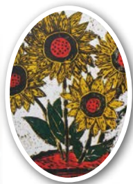
▲參加 103 全國學生美術比賽嘉義縣初賽 版畫類中年級組第二名