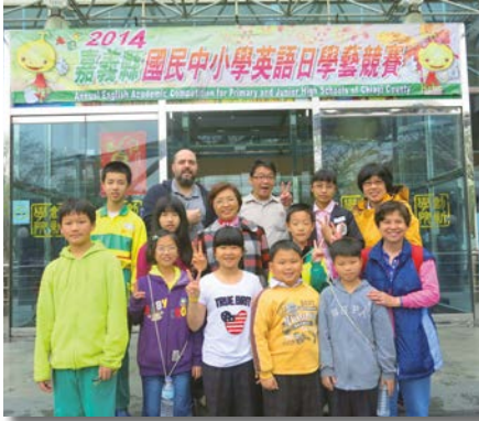
▲ 中師外師導師齊用心