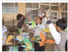
▶全班共同佈置公共藝術