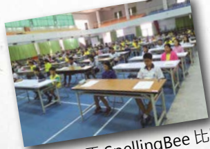
▲ 舉辦昭元盃 SpellingBee 比賽