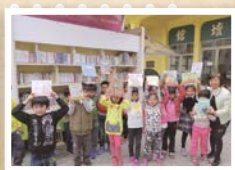
▲引進社會資源推廣閱讀