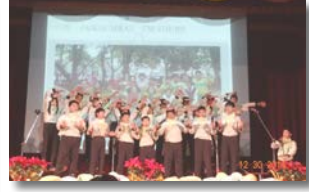
▲ 辦理英語歌唱聯歡會