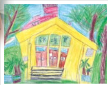
▲學生彩繪最美的校園角落