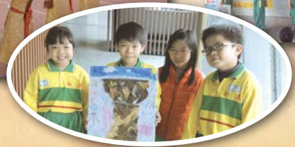
▲ 國際教育教案教學成果