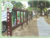
▲新港國小十大校樹教學步道