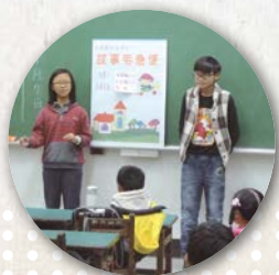
▲故事宅急便，大姐姐說故事