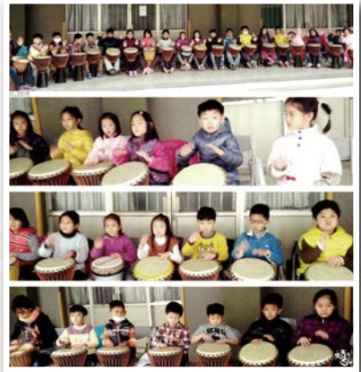
▲新港國小非洲鼓舞團