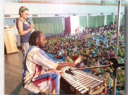
▲ 邀請西非音樂家蒞校表演